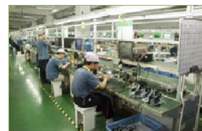
Fábricas de eletrônicos