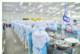
Fabricantes de alimentos