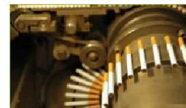
Fábricas de cigarros